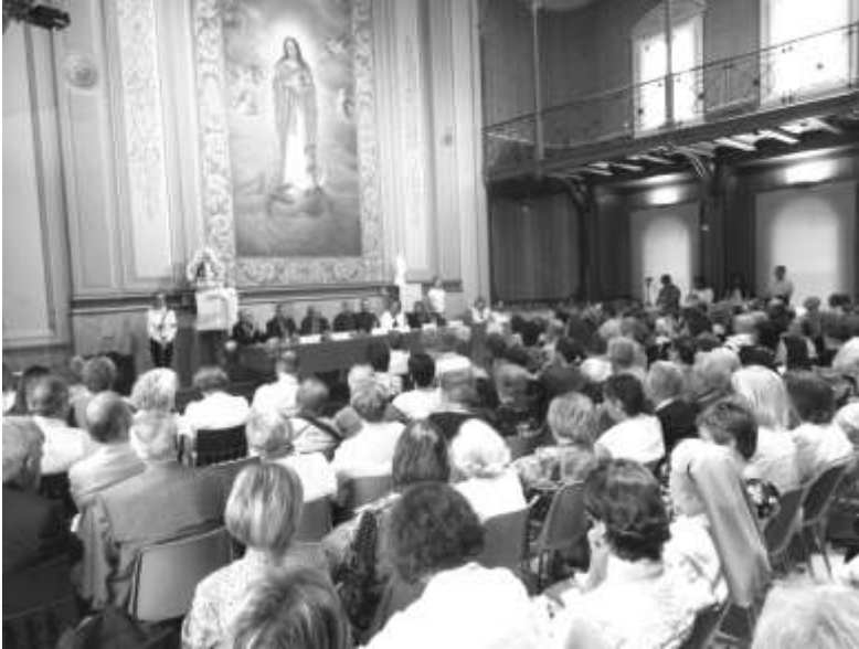
Panoràmica del Paranimf durant la realització del certamen del 2019

També hi ha hagut certàmens dedicats a honorar imatges o advocacions de parròquies o col·legis de Lleida com al 1997: a la Mare de Déu del Carme, de Lleida, 1998: a Santa Maria de Gardeny, de Lleida, 2000: a la Verge Nena, patrona del col·legi Lestonnac "L'Ensenyança", 2002: a la Mare de Déu del Pilar, de Lleida, 2008: a la Mare de Déu de l'Acadèmia, patrona del Col. Episcopal, 2009: a l'advocació "Mater Salvatoris", patrona dels col. de la Companyia del Salvador