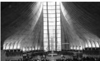
Exterior e interior del Santuari de Harissa, Líban.

Myriam (Maria) és estimada pels musulmans, citant-la 34 vegades en l'Alcorà i dedicant-li en ell una sura (capítol) sencera, la 19.