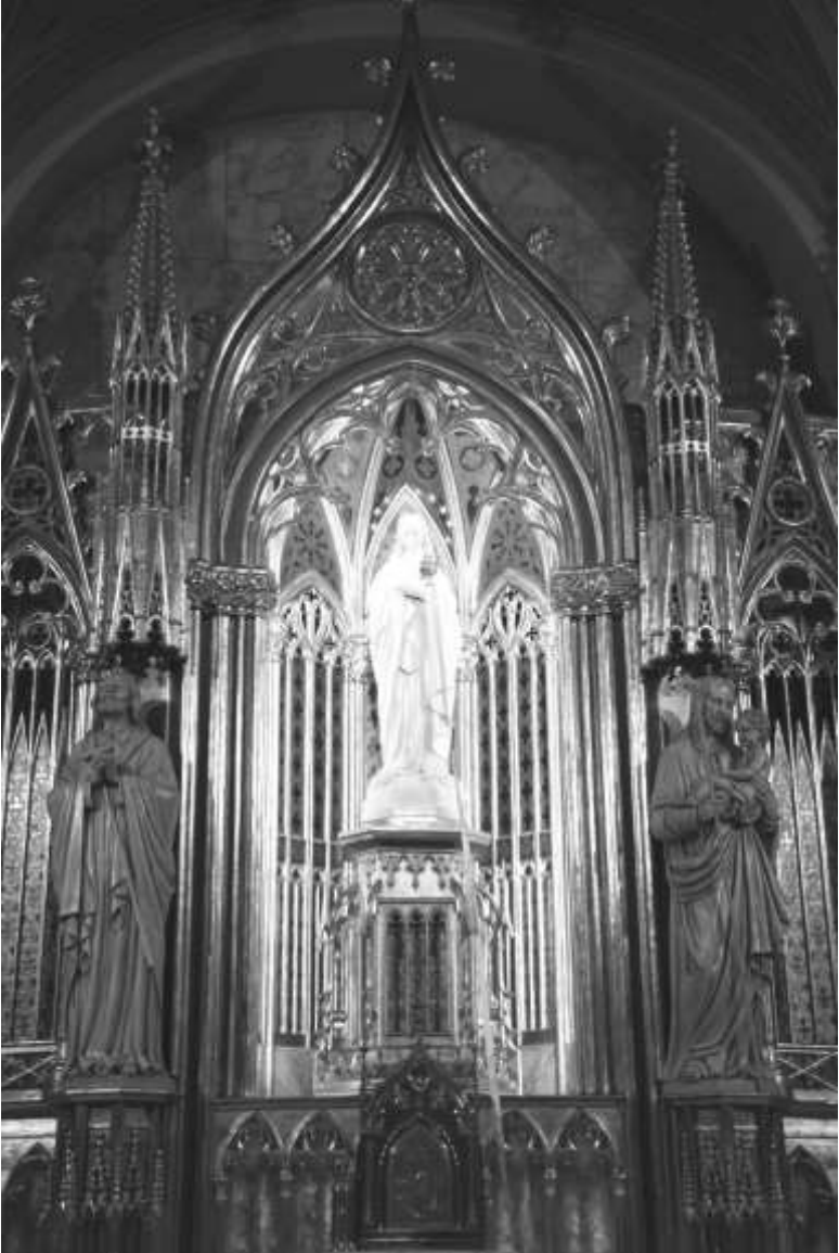
La Mare de Déu de l'Acadèmia a l'oratori de l'Acadèmia Mariana de Lleida.