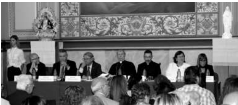
Presidència del Certamen Marià de l'any 2019.