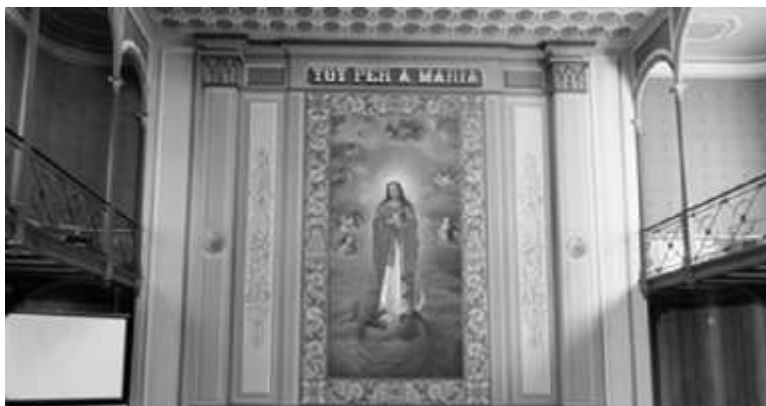
Claustre de l'Acadèmia Mariana (a dalt) i frontal del paranimf (a baix).