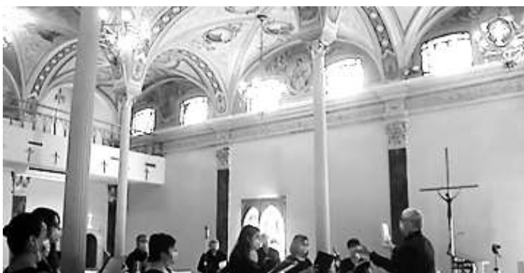
Diferents moments de l'enregistrament del concert del Petit Cor de la Catedral