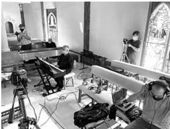
Part de l'equip de gravació en un moment de l'enregistrament de la coral.

Al principi va semblar un somni irreal, però de seguit va sorgir qui té inventiva i imaginació, un altre amb capacitat d'organització i... en un termini de dues setmanes estava tot enllestit i organitzat, fins i tot els detallats més ínfims i casuals, amb les 86 persones que van acceptar fer alguna cosa, de vegades petites, i la feina que havien de fer repartida i amb els terminis que havia d'acomplir cadascú per tal que, després, tot estigués a l'hora i es pogués acoblar en un resultat final que no havia de ser quelcom per sortir del pas, però sí volia ser una petita "gran producció" que ens permetés lloar Maria i fer-la present entre els que l'estimen, així com afavorir que algú la pugui trobar a partir de la nostra dedicació. Va venir després l'enregistrament amb un horari estricte per tal que no hi hagués més persones que les imprescindibles, evitant qualsevol tipus de coincidència en les hores en que s'havia quedat amb cadascú.