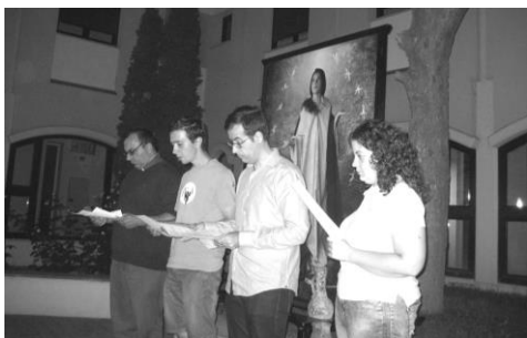
Diferents moments de la Vetlla de pregària amb Maria.