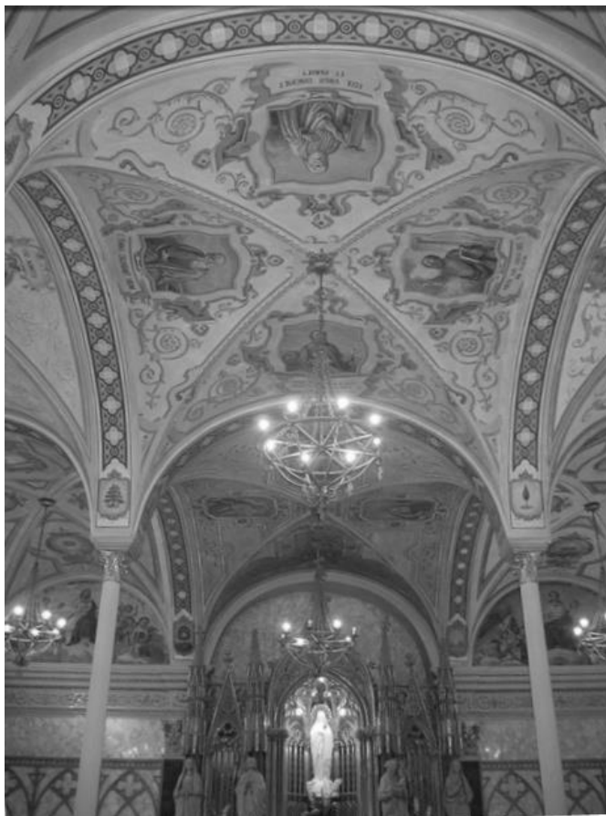
La Verge Blanca al seu cambril de l'Oratori de l'Acadèmia Mariana.