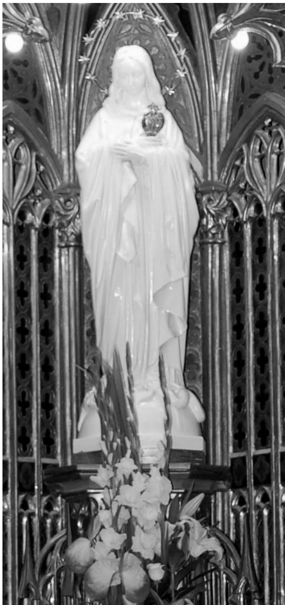
La Verge Blanca de l'Acadèmia, patrona de Lleida.