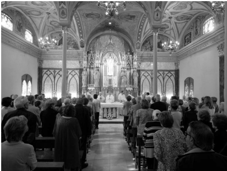
Eucaristia del dia de la benedicció de la restauració del retaule (01.10.16).