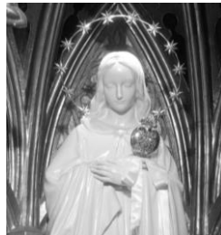
Oratori de la Verge Blanca de l'Acadèmia, lloc de culte de la Patrona de Lleida a l'Acadèmia Mariana.