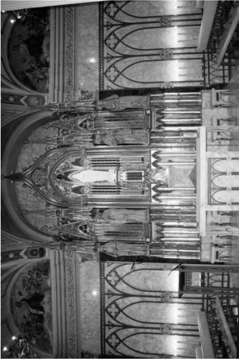
El retaule restaurat, el dia de la seva benedicció pel Sr. Bisbe de la diòcesi (01.10.16).