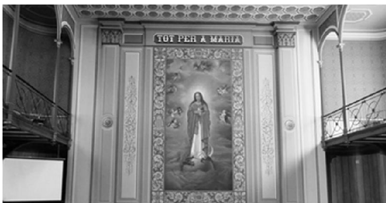
Claustre de l'Acadèmia Mariana (a dalt) i frontal del paranimf (a baix).