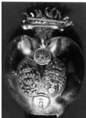
Anvers i revers del cor ofert a la Mare de Déu.