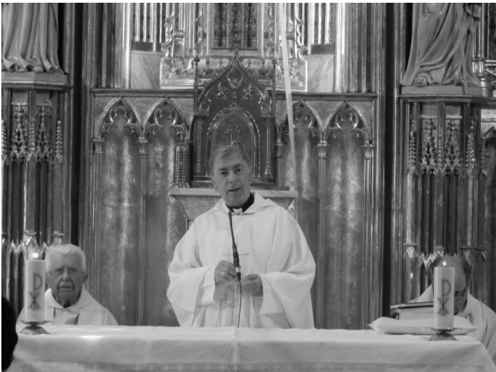
El Bisbe Salvador durant l'homília de l'eucaristia el dia de la benedicció de la restauració del retaule (01.10.6).