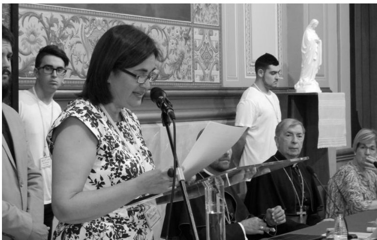
La Secretària del Jurat llegint l'acta amb el veredict