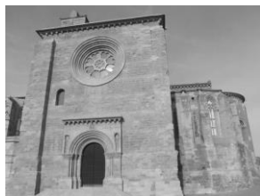
La Seu Vella de Lleida, dedicada a Santa Maria l'Antiga. Porta de l'Avemaria o de l'Anunciata, també dita de les Núvies, al transsepte. Al costat, la capella de la Concepció o dels Colom.

Era natural que els llibres litúrgics de l'Església de Lleida celebressin aquest gloriós misteri marià. En un Breviari Ilerdenc del segle XIV, tot i que no figura la Immaculada entre les festes dedicades a la Mare de Déu, a l'ofici de la Beata Virgine dels dissabtes se l'esmenta com a "Paloma Immaculada" i "Tota Immaculada, perquè en res va ser tacada". Al Breviari de Roda ( Breviarium secundum consuetudinem ecclesie Ilerdensis ), també del segle XIV, segurament còpia d'un altre més antic, ja consta el 8 de desembre com a festivitat de la Concepció de la Mare de Déu, però amb l'ofici de la seva Nativitat.