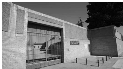
Monestir cistercenc de Santa Lucía de Zaragoza

molt conscient, però el pas del temps m'ha demostrat que donen un sentit únic a la meua vida. Obra i vida han de ser una mateixa cosa per aconseguir autenticitat. Sóc pintora tots els dies i en cada moment.