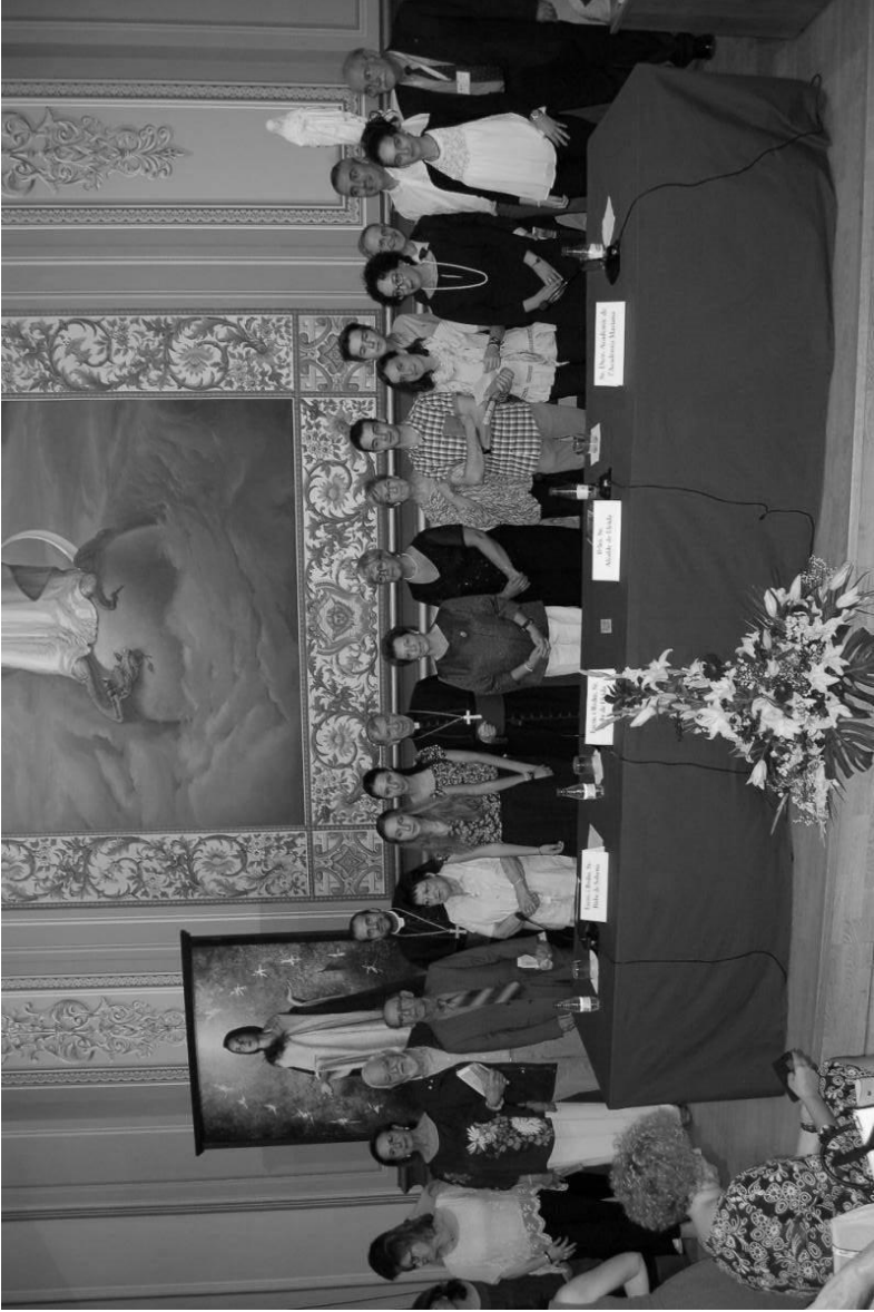
Guardonats, membres del Jurat i autoritats.