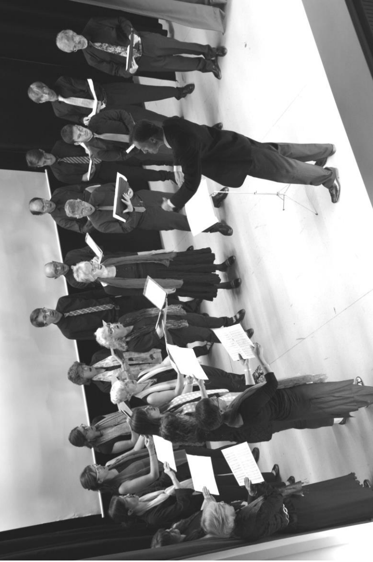
La Coral Shalom durant el concert que oferir en la vetllada del Certamen Marià.