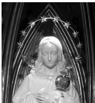
La imatge de la Verge Blanca sostenint el cor agraït dels lleidatans.