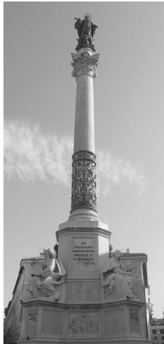
La Columna de la Immaculada Concepció, inaugurada a Roma per Pius IX a l'ambaixada espanyola, el 8 de setembre de 1857.