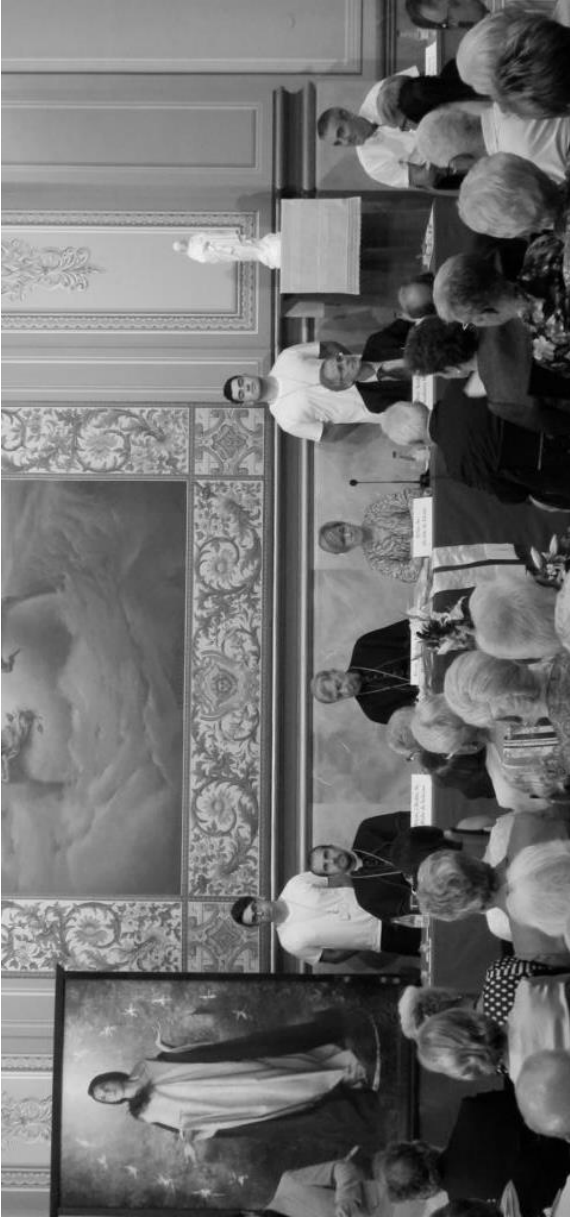
Presidència del certamen al paranimf de l'Acadèmia Mariana.