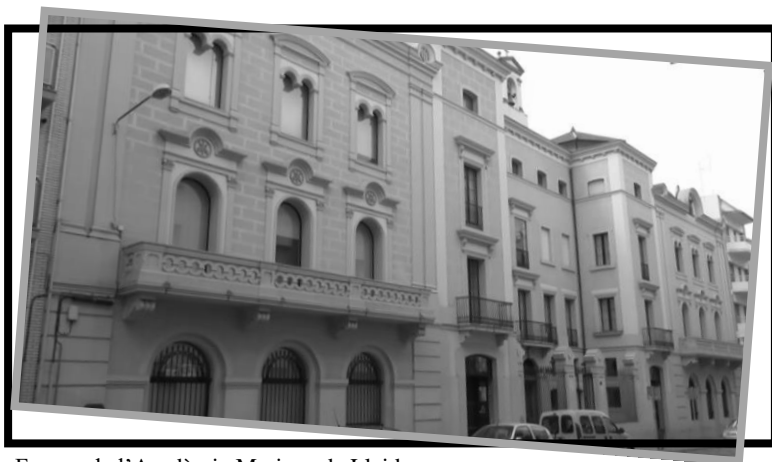
Façana de l'Acadèmia Mariana de Lleida

L'edifici que originàriament va ser la seu de l'Acadèmia ha estat remodelat i ampliat en la reconstrucció efectuada entre l'any 2003 i el 2006, passant a ser la Casa de l'Església-Acadèmia Mariana , on s'acullen diferents entitats de la pastoral de la diòcesi així com les instal·lacions pròpies de la Pontifícia i Reial Acadèmia Bibliogràfico-Mariana de Lleida.