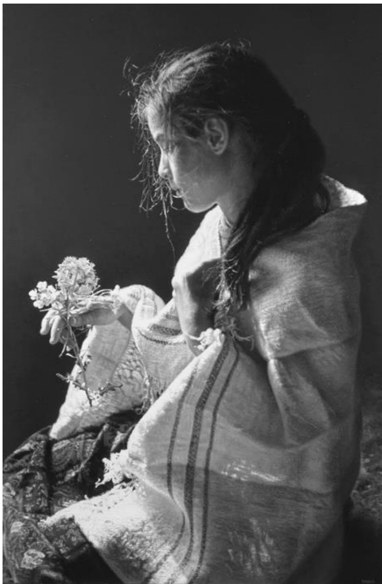
Pintura de la Gna. Isabel Guerra.