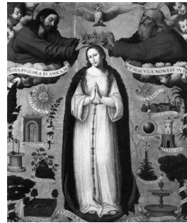
Abraçada a la Porta Daurada (Giotto, 1304-06) (esquerra). Immaculada Concepció (Vicent Macip, 1531-1535) (dreta).

Els altres atributs de la Immaculada Concepció s'inspiren en l'Apocalipsi: "Va aparèixer al cel un gran senyal: una dona vestida del sol, amb la lluna sota els peus, i duia al cap una corona de dotze estrelles." ( Amicta sole, lluna sub pedibus, in capite corona stellarum duodecim . Ap 12).