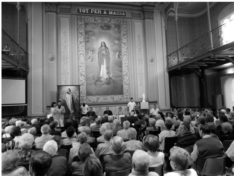
Aspecte del paranimf de l’Acadèmia Mariana durant la celebració del certamen.

A continuació es presenta el programa amb el que es va desenvolupar aquest acte en l’edició de l’any 2016, el qual es va celebrar al paranimf de l’Acadèmia Mariana.