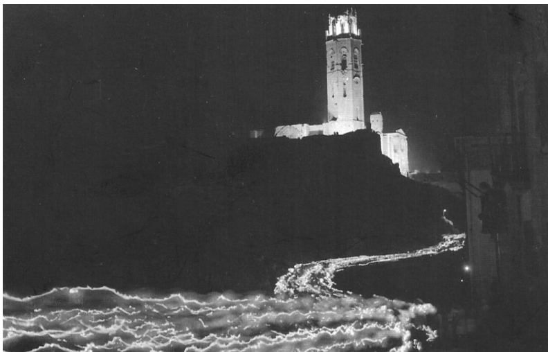
Devoció lleidatana a la Mare de Déu. Rosari de torxes des de la pça. Mn. Cinto fins a la Seu Vella l'any 1962 per commemorar el centenari de la fundació de l'Acadèmia Mariana. Es calculà que participaren una mica més de sis mil persones.