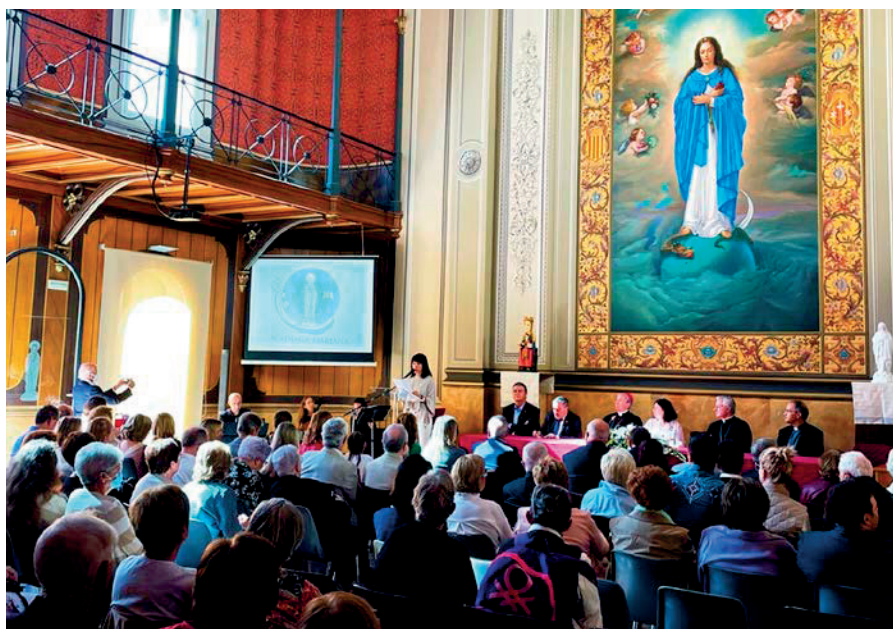
L'Arquebisbe d'Urgell presidí la Festa de la Mare de Déu de l'Acadèmia a invitació del Bisbe de Lleida i la Junta de l'Acadèmia Bibliogràfica Mariana.